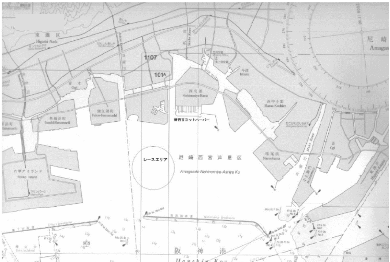
【添付図A】 レース・エリア

競技者は、完全に自己の責任でこのレガッタに参加する。規則4「レースをすることの決定」参照。主催団体は、レガッタ前、レガッタ中又はレガッタ後と関連してこうむった物的損傷又は人身傷害若しくは死亡に対するいかなる責任も負わない。