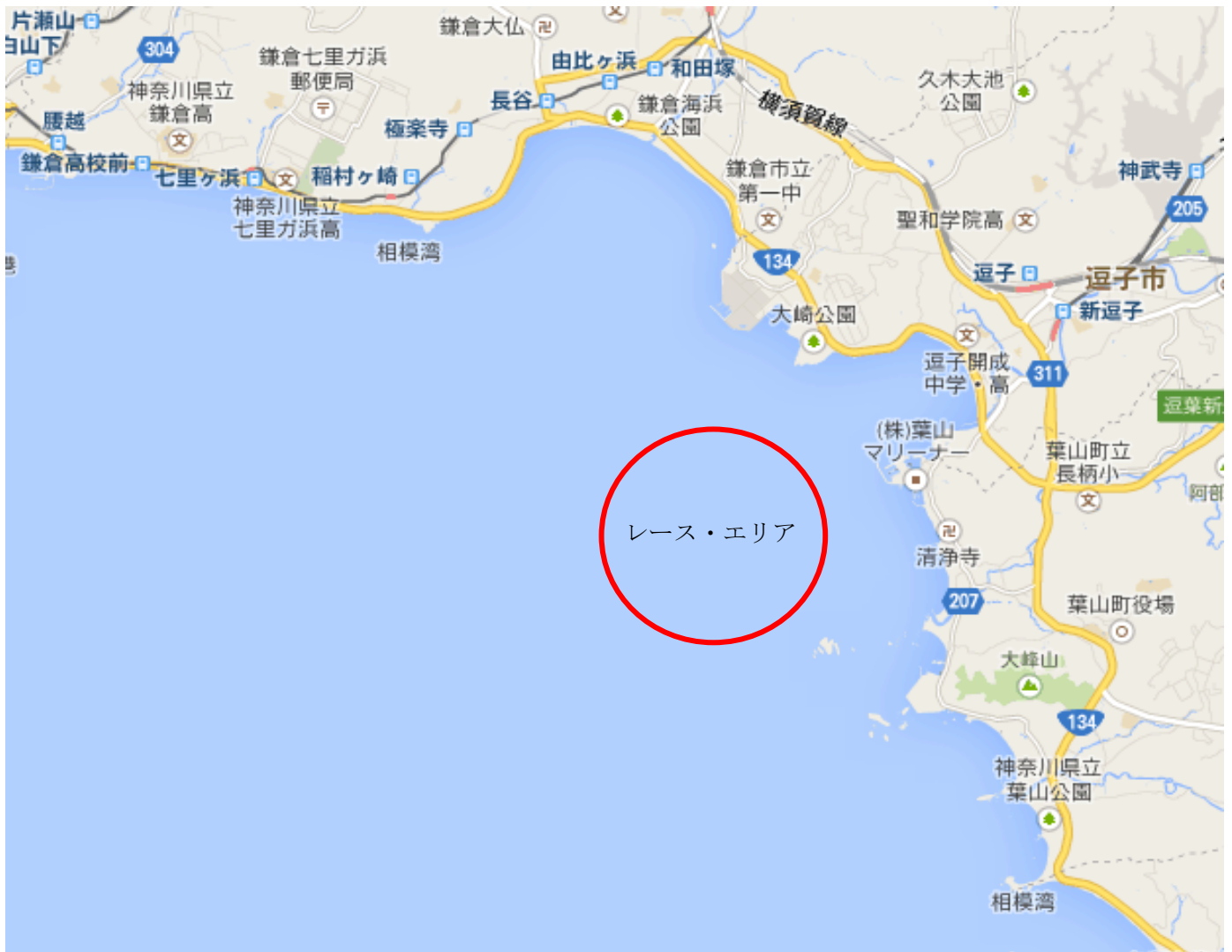
添付図A レース・エリア